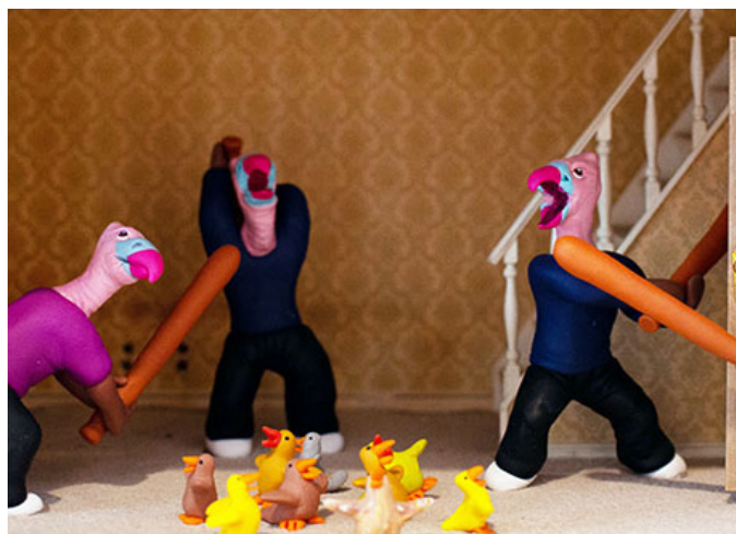
Clara Marciano, Du plomb dans l'aile , 2019, coll. van de kunstenaar

Het Art et marges museum, is een collectie werken gecreëerd in de marge van de kunst!