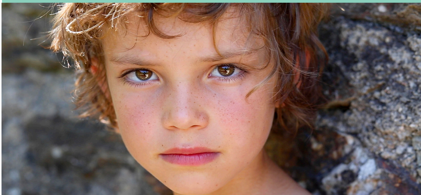
Annabel Sougné, Wake up , film, 2019

De tentoonstelling « Lisières » toont een verzameling werken die spreken over onze band met de natuur. Dieren, planten, mineralen en zelfs water komen aan bod in de werken van een veertigtal artiesten!