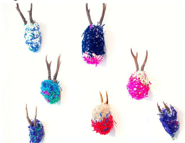
Laura Delvaux, coll. La 5 Grand Atelier

De tentoonstelling « Lisières » toont een verzameling werken die spreken over onze band met de natuur. Dieren, planten, mineralen en zelfs water komen aan bod in de werken van een veertigtal artiesten!